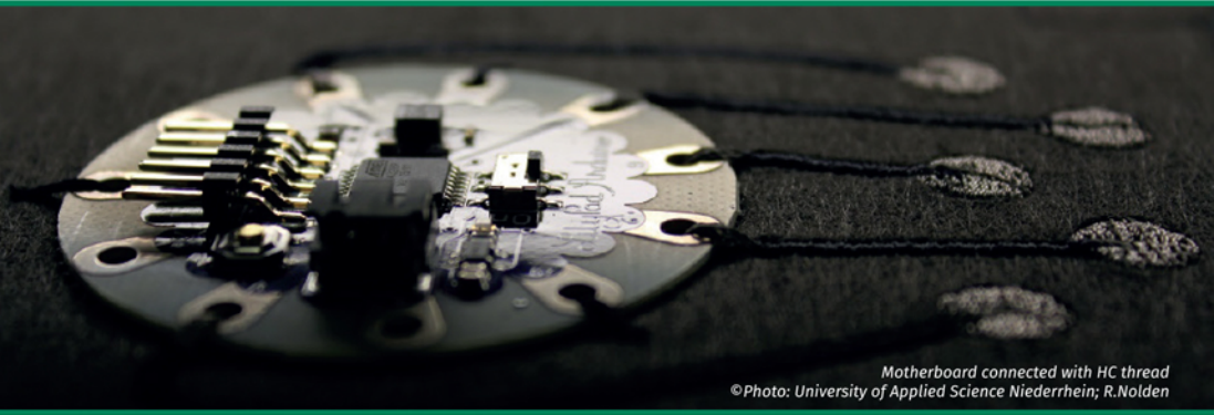
Motherboard connected with HC thread

Okos textília és ruházat létrehozása integrált áramkörökkel, elektromos vezető cérnával.